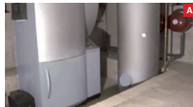
Holz-Pelletkessel mit Pufferspeicher Wood pellet boiler with buffer storage tank