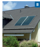
Solare Trinkwassererwärmung kontrollierte Wohnungslüftung mit Wärmerückgewinnung