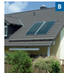
Solare Trinkwassererwärmung Solar thermal system for domestic hot water