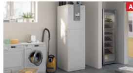
Sole-Wasser-Wärmepumpe mit Pufferspeicher Brine-water heat pump with buffer storage