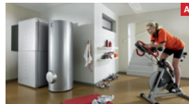
Luft-Wasser-Wärmepumpe mit Pufferspeicher und indirekt beheiztem Warmwasserspeicher Air-water heat pump with buffer storage tank and indirectly heated hot water storage tank