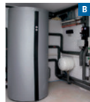
Moderner Gas-/Öl-Brennwertkessel mit Warmwasserspeicher Modern oil/gas condensing boiler and hot water storage tank