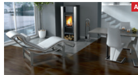
Holz-Einzelraumfeuerstätte mit integrierter Wassertasche Wood-based single-room furnace with collection basin