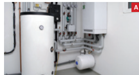
Moderner Öl-Brennwertkessel Modern oil condensing boiler