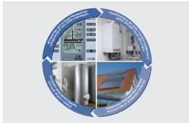
Zusammenspiel Wärmeerzeugung und -speicherung Interaction between heat generation and storage