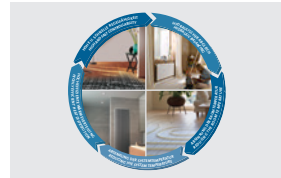
Einflussfaktoren für effiziente Wärmeübergabe Influencing factors for efficient heat transfer