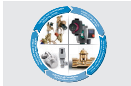
Einflussfaktoren für effiziente Wärmeverteilung Influencing factors for efficient heat distribution